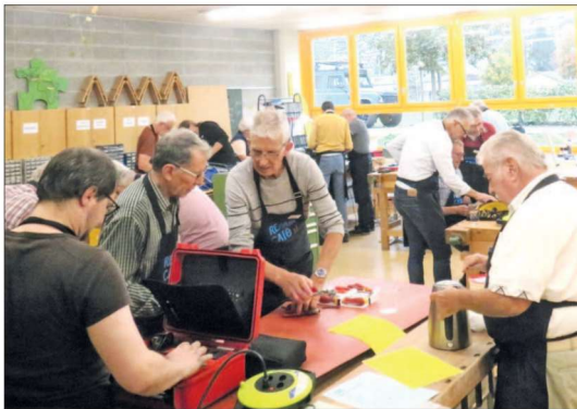
Das Reparaturteam freute sich am zweiten Tag über viele Besucherinnen und Besucher.

pd. Schon kurz nach Eröffnung um 10 Uhr bildeten die Gäste mit ihren defekten Gegenständen im Schulhaus Ebnet eine lange Schlange. Das Reparaturteam wurde beim Empfang und auch in der Werkstatt ziemlich gefordert. Während der geplanten sechs Stunden gingen 116 Gegenstände durch die geschickten Hände der ehrenamtlichen Reparatereure. Immerhin konnten fast 60